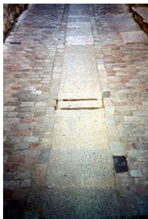
Fig.1: Calle Medieval Típica

La historia de los contenes está estrechamente vinculada a la de la pavimentación, y ésta a su vez a las necesidades urbanísticas de cada período histórico y a los condicionamientos tecnológicos en el tratamiento de los materiales empleados. El origen de los bordillos o contenes propiamente dichos se encuentra en el Renacimiento. En las ciudades medievales predominaban los peatones, por lo que el trazado de sus calles se hacía para recorrerlas pausadamente. El uso masivo del vehículo con ruedas en el Renacimiento (la España de Carlos V conoció un fuerte desarrollo de este tipo de vehículos), contribuyó de una manera importante a la evolución del trazado viario. De esta manera, surgió la necesidad de separar los tráficos de peatones y vehículos, empleándose para ello bolardos de piedra o metálicos como elementos delimitadores.