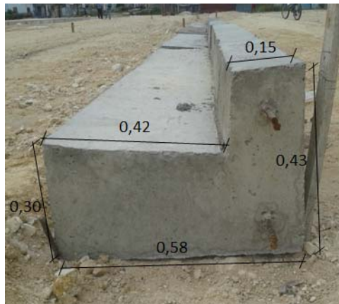
Fig.5: Detalle de contén integral

Como se muestra en la siguiente figura existe una diferencia entre la sección transversal del elemento con la que originalmente se encuentra establecida en la norma, siendo necesario una revisión del proyecto por el cual se está construyendo en la planta de prefabricación, ya que no cumple las especificaciones geométricas normadas, propiciando un gasto mayor de materiales y una aumento del costo.