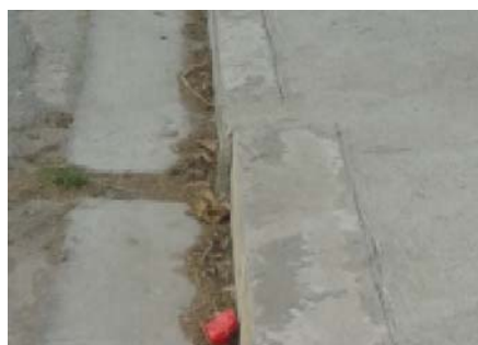
Fig.4: Detalle de contén integral ejecutado

Existen diversas obras en la Provincia de Cienfuegos donde se ha aplicado esta técnica, siendo esta principiante es necesario una revisión de estos elementos, ya que se observa una aumento en su sección transversal diferente al diseño original que se encuentra en la norma, por lo que es necesario hacer una análisis comparativo con el fin de resolver esta disyuntiva.