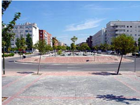
Fig.2: Ejemplo de colocación de contenes

Los contenes y piezas complementarias no deberán tener coqueras, exfoliaciones, grietas ni rebabas en la cara vista. En las unidades de doble capa es admisible que, en las caras no vistas, la textura pueda no ser totalmente cerrada. En éstos, la doble capa cubrirá totalmente las caras vistas de las piezas. Tampoco será admisible la aparición en la superficie de la cara vista de áridos provenientes del núcleo.