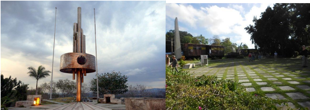
Figura 5. Monumento Nacional erigido a la Batalla de Santa Clara y a la acción de toma y descarrilamiento del Tren Blindado.

En la cima de la Loma del Capiro se levanta el monumento alegórico a la Batalla de Santa Clara, realizado por el escultor José Delarra. Representa la unión de diferentes calibres de armas de fuego unidas por un aro, la obra descansa sobre una base de mármol y a su lado ondean, permanentemente, el pabellón nacional y la bandera del movimiento 26 de julio.