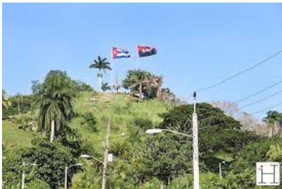
Figura 1. Situación geográfica del paisaje Loma del Capiro.

El nombre "Capiro", por el que se le conoce a la histórica elevación, fue dado por Cristóbal de Moya, antiguo dueño de los terrenos donde se encuentra situada, por su semejanza a una montaña de igual denominación visitada por él entre los cerros que circundan a la ciudad panameña de Portobelo. El acontecimiento quedaría plasmado en los escritos conservados de dos de los participantes en el viaje.