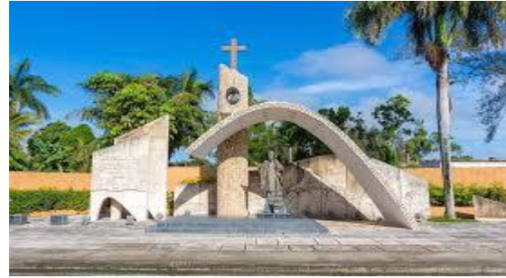
Figura 7. Monumento al Papa Juan Pablo II.

Juan Pablo II, erigido por la Iglesia Católica en común acuerdo con el gobierno de la ciudad, en su décimo aniversario; se inauguró el 23 de febrero del año 2008 y es la primera estatua religiosa que se erige en Cuba fuera de los templos.