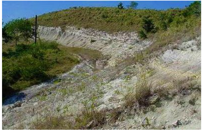
Figura 4. Límite que separa dos períodos geológicos, el Cretácico y el Terciario (LKT)

En el ámbito científico, según investigaciones del doctor en Geología Reinaldo Rojas Consuegra, los sedimentos y restos contenidos en la formación, "Dos Hermanas" evidencian en Santa Clara, Cuba, el límite que separa dos períodos geológicos, el Cretácico y el Terciario(LKT). También se destacan significativas evidencias halladas, a inicios del siglo pasado, del Meteorito de Chicxulub, que causó hace millones de años la extinción masiva de los dinosaurios. El impacto generó dantescos tsunamis, terremotos y tormentas y afectó sensiblemente a Cuba, y en particular al área de estudio, dada su relativa cercanía a Yucatán.