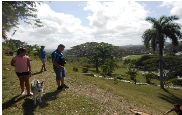
Figura 8. Prácticas socioculturales en la Loma del Capiro.

Hoy, la Loma del Capiro es remontada por muchas personas, ya sea utilizando el senderismo o a través de las dos escaleras que llegan hasta su cima. Turistas nacionales y extranjeros visitan a este atractivo local. También puede encontrarse allí, asiduamente, a pobladores de Santa Clara, que suben para gozar de la tranquilidad de la naturaleza, hacer ejercicios físicos, estudiar o dibujar a la sombra de algún árbol o reunirse “a descargar” alrededor de una guitarra.