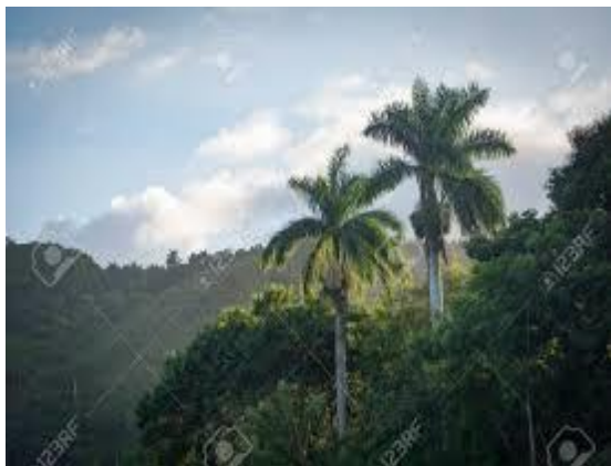
Figura 2. Loma del Capiro.

La Loma del Capiro pertenece al paisaje de las Llanuras, alturas y montañas de Cubanacán, posee un clima tropical cálido con temperaturas medias anuales inferiores a los 25°C, estacionalmente húmedo (1300mm), constituido por rocas sedimentarias y metamórficas. Predominan los suelos pardos tropicales. La vegetación consiste en cuabales, charrascales y de sabanas serpentinosa donde crecen palmas ( Roystonea regia ), ceibas ( Ceiba Pentandrá ) y algarrobos ( Hymenaea courbaril ). El sitio es hábitat de diversas especies de aves como el Tomeguín del Pinar ( Tiaris canorus ) y el Azulejo ( Sialia currucoides ).