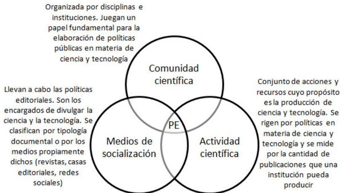
Figura 1. Relaciones entre políticas editoriales (PE) y otros recursos de la ciencia y la tecnología