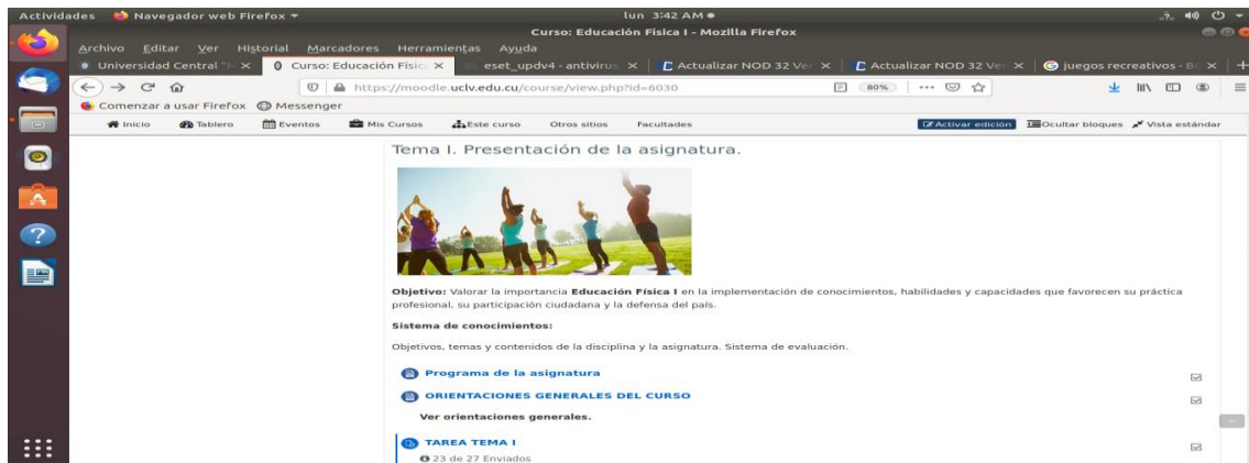
Figura Nro 1