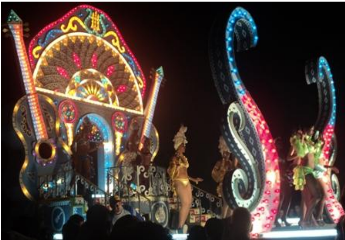
Carroza del año 2011.