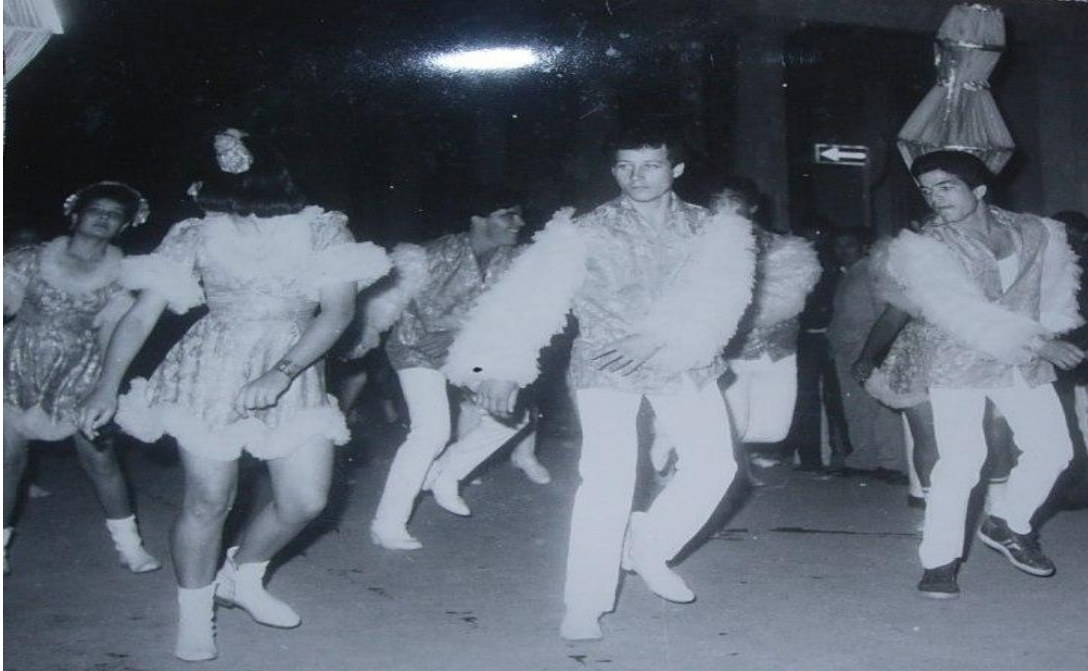
Vestuarios de comparsas de los barrios.