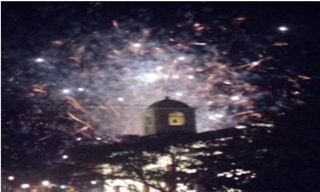
Fuegos artificiales de la parranda quemadense.