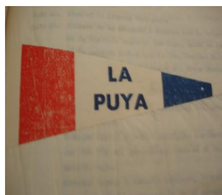
Banderas representativas de los barrios: el Perejil y la Puya.