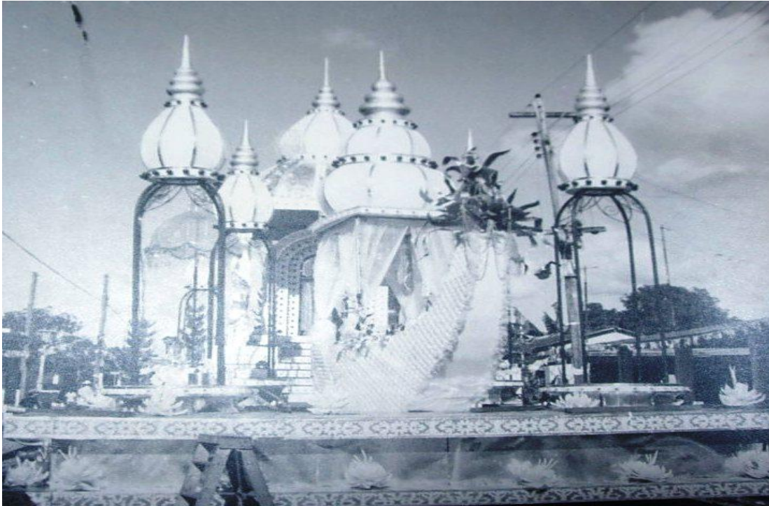
Carroza de los años 80, del siglo XX.