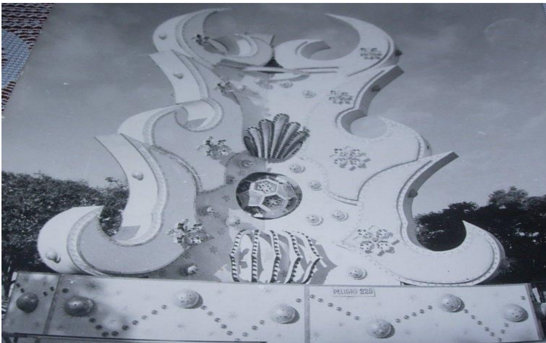
Trabajo de plaza de la década de los años 90.