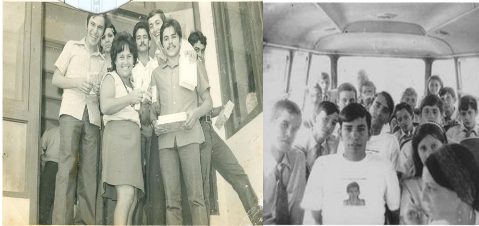
Sonrientes, cumplimos con Fidel

Nos afiliamos al Destacamento Pedagógico Manuel Ascunce Domenech, sonrientes, seguros. Entramos en una etapa sublime de nuestra existencia violentando el futuro, compartiendo la evidencia de aulas saturadas de azul, de rostros contemporáneos con nosotros mismos, en construcciones de mucha luz, sin imaginar que estábamos edificando una manera de ser