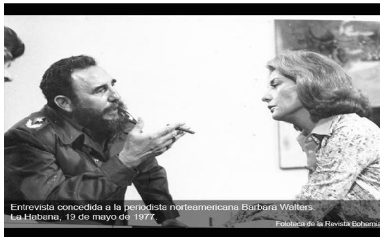
Su pelo ensortijado y su barba copiosa

Pasados unos meses, en el salón de reuniones de mi escuela en el campo, pudimos mirar al Comandante en su entrevista con la periodista norteamericana Bárbara Walter. Era preciosa, pero Fidel tenía sobre él toda la atención al margen de cualquier atractivo femenino de su experimentada interlocutora, eso me daba mucha gracia a mí y a los demás, porque adorábamos al Jefe de la Revolución Cubana, y absolutamente todo lo que contestó aquella noche, nos pareció insuperable, especialmente cuando la Walter osada y prepotente le interrogó acerca de su vida privada. Fidel se reclinó en el asiento, soltó una bocanada de humo de su tabaco acompañante, sonrió de manera pícaro, con su pelo ensortijado, mostrado sin gorra y su verde, muy verde. Se acarició la barba copiosa, y respondió: -Lo único que puedo decirle de mi vida privada es que... no voy a decirle nada- Nos empezamos a reír en carcajadas irreverentes y entrañables, ante aquel, nuestro primer televisor a color, recién regalado por Fidel. Era mayo de 1977.