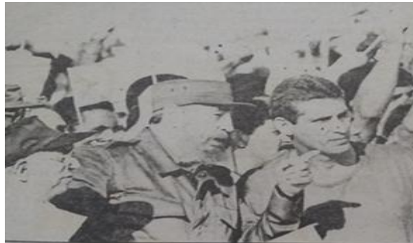
El gesto impresionante

Mientras leía mi discurso, en un momento en que alcé la mirada vi al Jefe de la Revolución, decirle algo a Díaz-Canel, señalándome. Se me reseco la boca. Me repuse. Seguí mi discurso. Concluí estableciendo una atrevida empatía de preguntas-respuestas con la multitud, como hago con mis alumnos. La gente respondía afirmativa o negativamente, a mi provocación combativa, enarbolando ideas definitivas para la multitud. Terminó el acto. Volvimos a la casa y claro, en mis hijos y en mí, Fidel. Al día siguiente salió en el periódico Vanguardia la foto de Fidel en el gesto que me había impresionado. Mi conexión con él fue mayor.