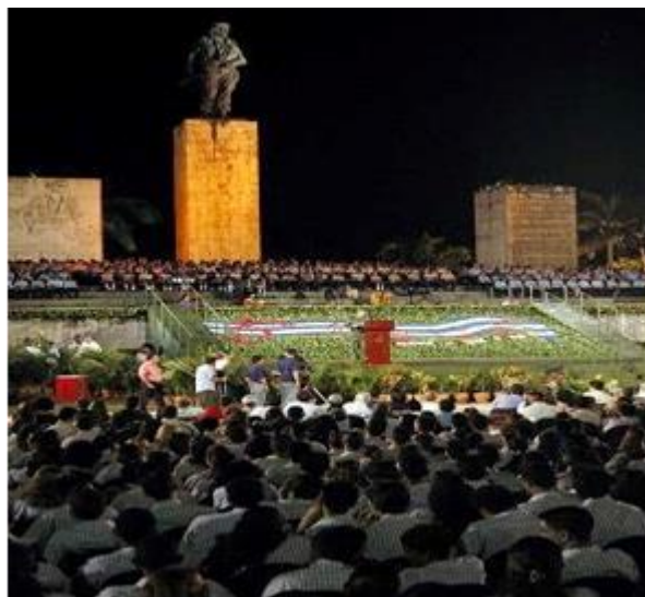
Nuevos jóvenes con Fidel y Che

A las 2:00pm comenzó la movilización hacia la Plaza, estábamos tan entusiasmados que convertimos la alegría en disciplina y en una dinámica de participación consciente. Era el Día de la Cultura Cubana y esta vez la celebración sería en la Plaza de singular significación para nosotros, junto al Che y al Comandante en Jefe. Tal y como Fidel había dicho en junio de 1961, el arte no estaba yendo al pueblo, sino formando parte del pueblo. Jóvenes estudiantes y recién graduados protagonizaron la gala cultural, junto a la vanguardia artística, realizando el vaticinio sustancial de Palabras a los Intelectuales. Una orquesta juvenil de guitarras sonó hermosísima en la Plaza. Después Fidel entregó los diplomas a los mejores graduados. Al percibir indistintamente el silencio o la algarabía de la juvenil multitud, sentí: “otra vez son sus muchachos, agradecidos cerrando una etapa de sus vidas e iniciando otra, con el privilegio de la compañía de Fidel”. Vino al pódium y puso el colofón.