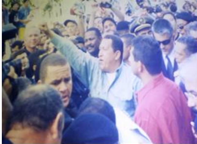
Junto a Chávez, por Fidel

Este último acontecimiento nos permitió combatir en un sentido menos figurativo, más realista cuando Chávez llegó, la mayoría de los cubanos, incluyendo los niños, estábamos bien cerca de la enorme puerta de cristal por la que entraría al Palacio del Gobierno de Porto Alegre. Llegamos fácilmente junto al Presidente bolivariano. Stevenson y Juantorena le cubrieron la espalda y un lateral. Chávez con su jovialidad humilde dialogó brevemente con nosotros- ¿Cómo está Fidel? - ¡Bieeeeeeeeeen! Conversó más, pero la bulla de la gente no me dejaba oír lo que decía. Me escabullí, acercándome lo más que pude y retraté al mejor amigo de Cuba.