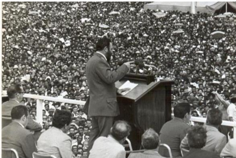
Su voz en el dolor multiplicado

sentimiento de cariño y de admiración para nuestro pueblo...Hoy solo quiero decirles...que este acto constituye...uno de los días más felices de nuestras vidas” (5) Por ese sendero, de la mano del Comandante en Jefe, añadí al sentido hermosísimo de octubre, la iracunda consternación por el crimen de Barbados. Aquellas muertes imprevistas en la plenitud de la vida, me llegaron como pérdida personal. Primero las filas interminables de la gente ante los féretros, después la amargura intransigente y enérgica de las palabras de Fidel. Todavía le recuerdo en la sobriedad de su traje de gala, desde la claridad de su voz, con la fuerza extraordinaria de su pecho.