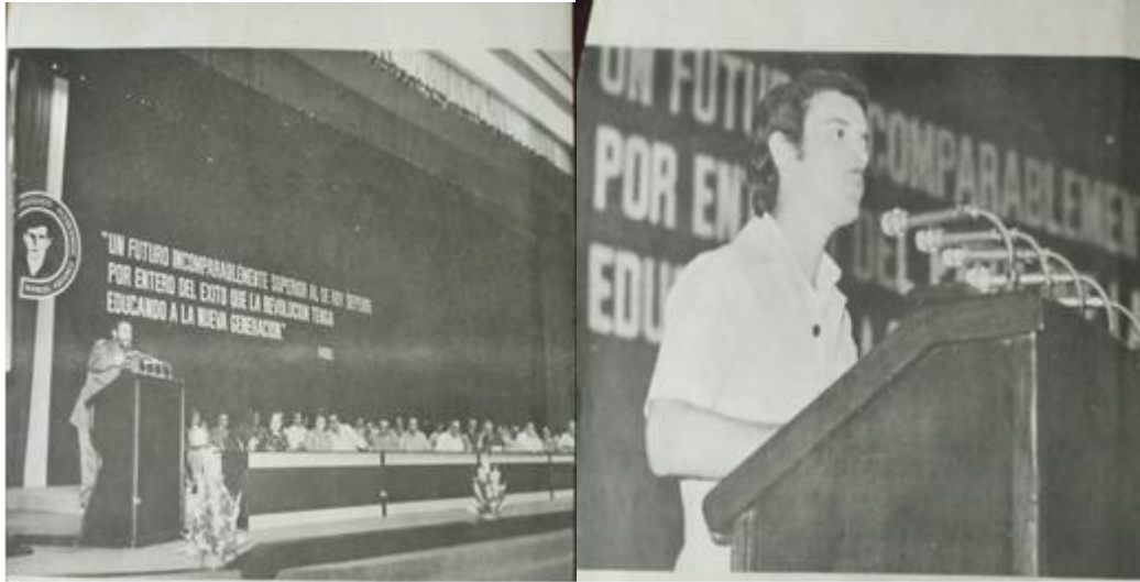
Fidel graduaba a sus brillantes profesores

En sus discursos de graduación, el Comandante celebraba con frecuencia nuestra abnegación y nuestra perseverancia. Vaticinaba que siendo así, cumpliríamos todos los propósitos de nuestras vidas. Nos instaba a impartir clases de calidad, a estudiar, a ser ejemplo, a hacer de la escuela cubana un lugar de autoridad moral y convivencia solidaria. Aquellos momentos inolvidables de titularnos comenzaron en el teatro Lázaro Peña con el primer contingente.