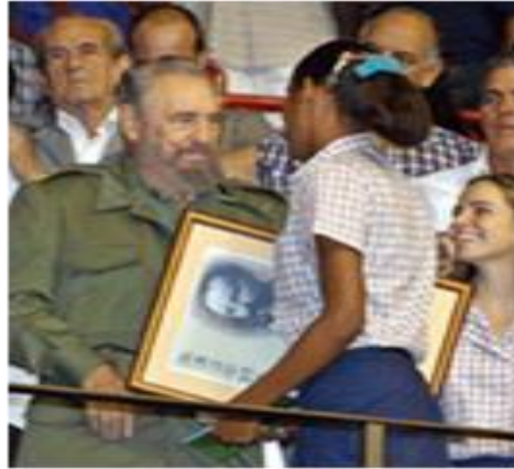
Son sus muchachos

que me senté al llegar. Mis ojos del amor lo vieron agotado, paradójicamente vital, lo vi más noble en su ancianidad, contento de sus muchachos, vivo, como el que no descansa, con la satisfacción de los inconformes, de los que siempre quieren hacer más.