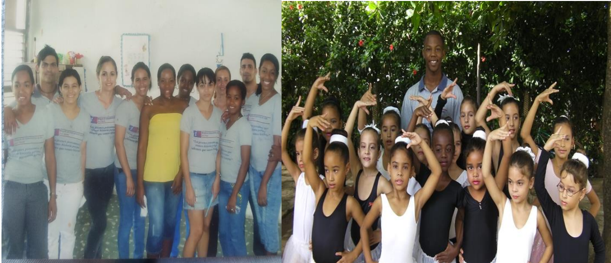
Una vez más, el sueño realizado de Fidel