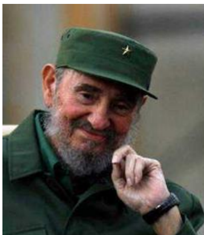
Este Fidel, siempre con nosotros