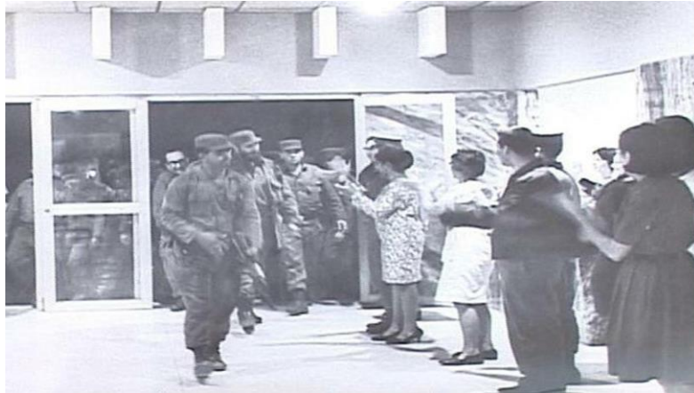
La luz, las botas, la alegría

rostros alegres de la gente eran pruebas de que se cumplía mi sueño infantil de tenerlo cerca.