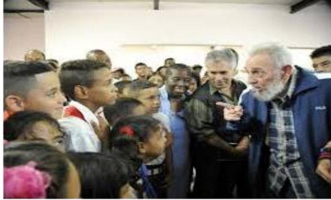
Privilegio de infancia