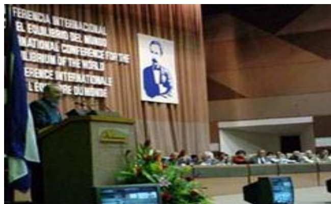
Retornar a la Patria, reencontrar a Fidel

El último día del mes de enero volvimos a la patria. Jamás olvidaré la sensación experimentada desde el aire cuando vi a Cuba. Distinguí a mi caimán nítidamente, afloró la entrañable historia de mi país y me pregunté ¿cómo puede traicionarse algo así? ¡Qué alegría sentí! Esa alegría creció al saber que iríamos al Palacio de Convenciones donde el Comandante casi ya clausuraba la III Conferencia Internacional por el Equilibrio del Mundo.