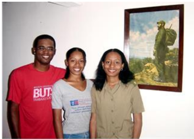
Al amparo de Fidel