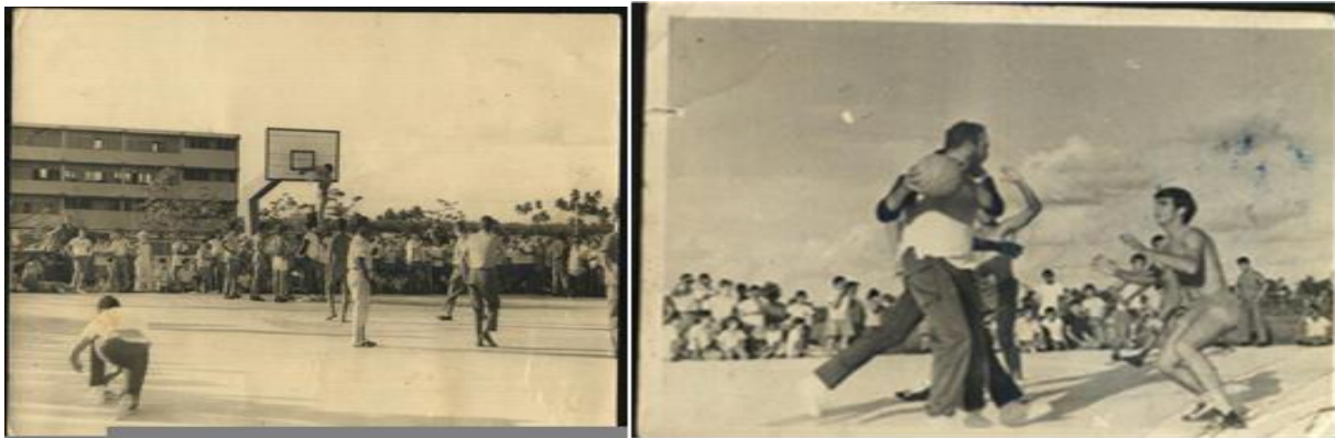
Fidel, como un adolescente