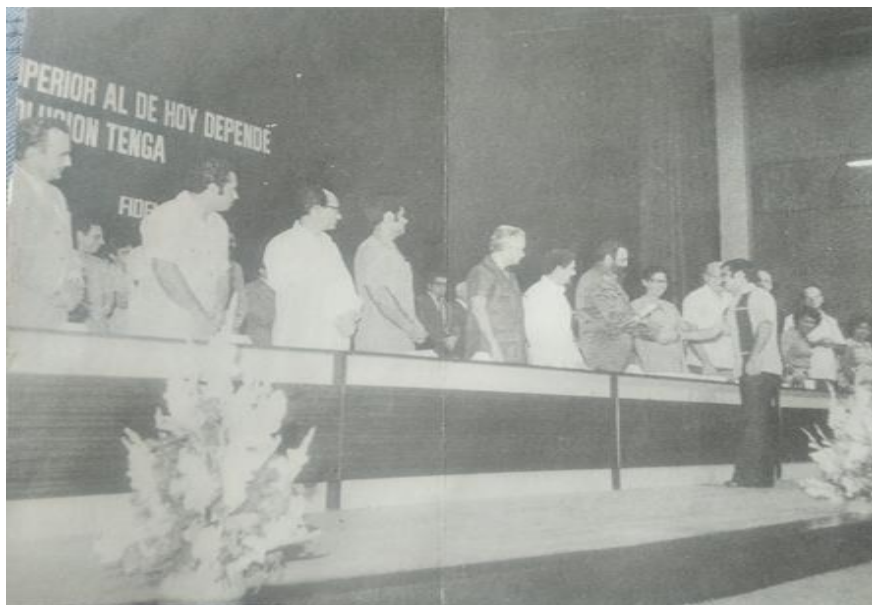
El talento de Ramiro, premiado por Fidel

Nos dijo: "Miren 20 años adelante. Esa será la sociedad del futuro. Esa es la sociedad que está en manos de ustedes: profesores y maestros, Les damos las gracias por todas sus respuestas: cuando se creó el Destacamento, cuando se mantuvieron en los estudios, cuando fueron capaces de graduarse, cuando son capaces de proseguir los estudios superiores, y dar una respuesta masiva como han dado. Ustedes son, mujeres y hombres, capaces de proponerse. (10)