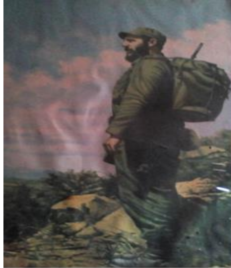
El Fidel de mi primicia

Permanentemente percibí que me miraba, sabía que me miraba. ¿Cómo podía ser de otro modo si, desde mi posición en la fila de primer grado, yo quedaba exactamente en la dirección de su mirada? El cuadro de Fidel, puesto en una pared de mi escuela no cambiaba de lugar, y yo, en la fila, tampoco.