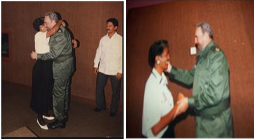
El abrazo anhelado

Cuando le pedí el abrazo anhelado, venido de la infancia, se levantó enseguida y consumó mi sueño. ¿Entablamos un diálogo, con sus preguntas –Desde cuándo recitas? Respondí -¿Quién te enseñó? -Respondí –No dejes de recitar nunca -Me aconsejó. Y nos separamos solo físicamente.