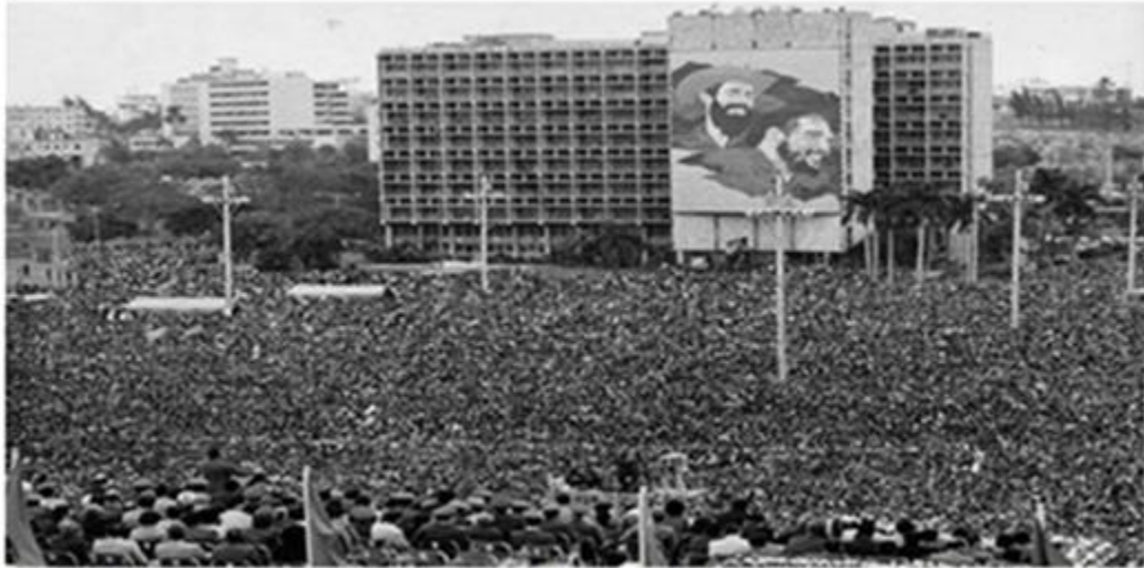
Fidel Castro Ruz en el acto en la Plaza de la Revolución por el 1er. Congreso del Partido. Diciembre de 1975.

y trabajador. Todos conocemos su extraordinaria capacidad de dirigente y admiramos con profundo cariño sus numerosas virtudes, entre las que se destacan su honestidad, y sinceridad revolucionarias, su modestia y su excepcional sensibilidad humana...” (4)