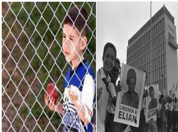
Estrategia de la victoria

El primer reclamo de Villa Clara por Elián fue en el mes de enero del año 2000. A partir de las cuatro de la tarde del día 12, el pueblo desfilaba enardecido ante la gigantesca obra de Delarra: nuestro Che en marcha. Los símbolos adquirieron matices especiales. Pensamientos y emociones se mezclaban en consignas de lealtad, condenas al imperialismo, exigencias del retorno del niño a la Patria, que, coreadas por la multitud, poseían una fuerza verdaderamente extraordinaria.