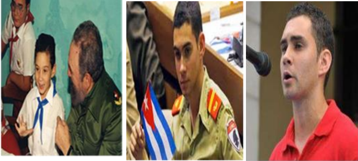
Crecido, donde Fidel