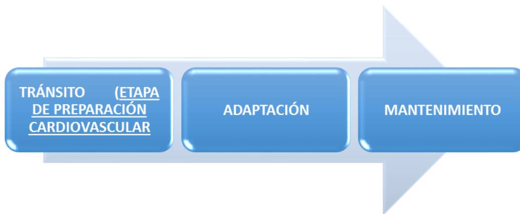
Gráfico 1. Ubicación de la etapa de preparación cardiovascular en el desentrenamiento deportivo

La aplicación del sistema de influencias (programa de ejercicios) se llevaría a cabo si el deportista al ser evaluado por su médico del deporte no presenta otra patología o aparece en los exámenes realizados algún hallazgo que requiera de otras investigaciones. A continuación se presenta el siguiente gráfico para ilustrar al lector de cómo queda ubicada la preparación cardiovascular según su temporalización en este proceso, haciendo énfasis en que está creada para deportistas retirados que posean valores ecocardiográficos no acordes con un equilibrio entre espesores parietales y diámetros de la cavidad cardíaca.