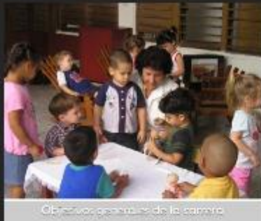
Objetivos generales de la carrera