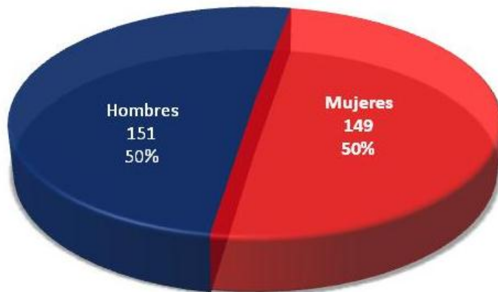
Gráfico 3. Composición de la muestra

149 resultaron ser mujeres y 151 hombres dentro del rango de edad de 25 a 65 años.