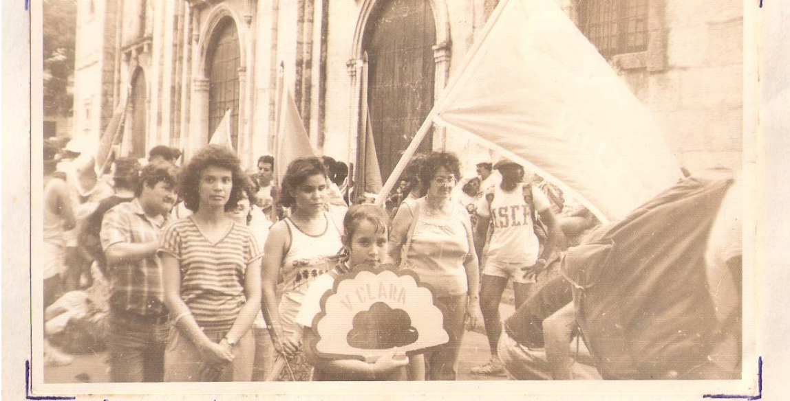
Desfile de la apertura del Encuentro entre el grupo Luis Braille de Sta. Clara y el Ernest Thielman de Matanzas.