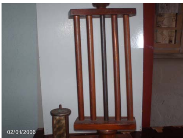
Trofeo obtenido por la delegación Villaclareña en campeonatos de la ANCI.