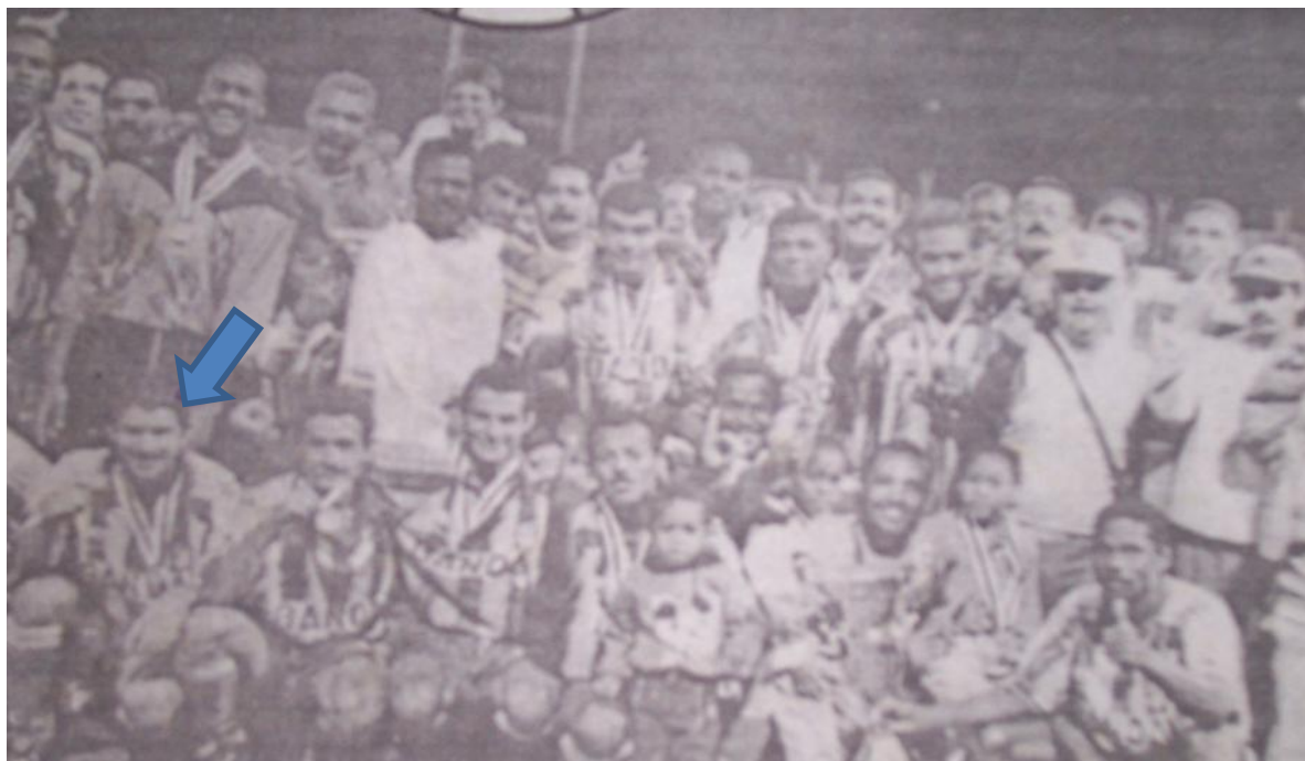
Campeonato nacional en el año 1997