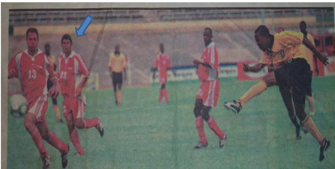
Eliminatorias mundialistas en Panamá en el año 1998.