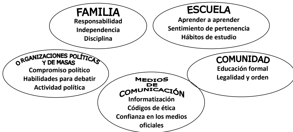
Gráfico No. 3. Interrelación educativa.